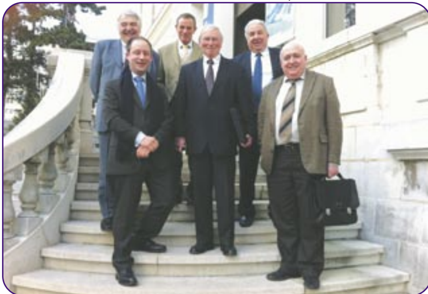
Dernière réunion à la préfecture de Haute-Savoie

Votre maire, les maires adjoints, soutenus par la majorité municipale, continuent de travailler à la réussite de cette communauté de communes si importante pour l'avenir de notre bassin de vie.